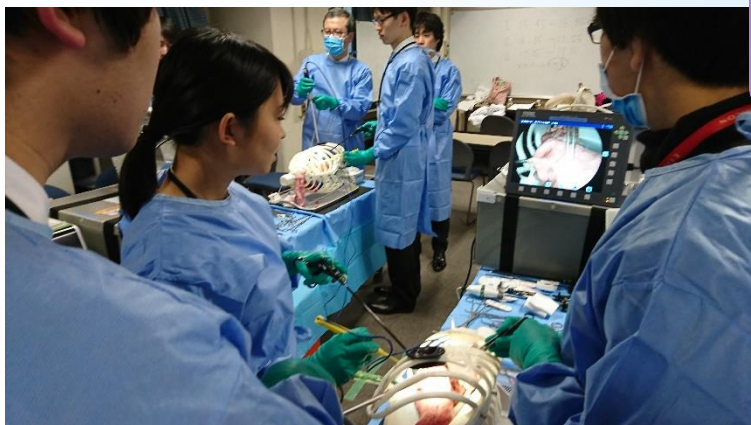
手術トレーニングの様子 (昨年度の入局説明会)

ブタの心肺ブロックを使って、胸腔鏡 手術、肺切除、肺移植を体験しよう! TGTS certificate が発行されます